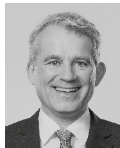
Beat Jans Regierungspräsident Kanton Basel-Stadt